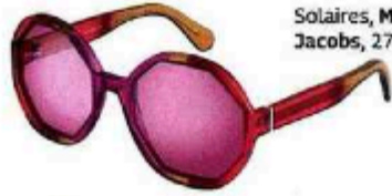
Solaires, Marc Jacobs, 270 €.