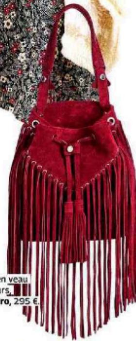
Sac en veau velours, Sandro, 295 €.