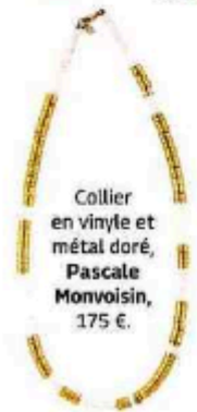
Collier en vinyle et métal doré, Pascale Monvoisin, 175 €.