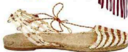
Sandaes en corde, Ball Pagès, 180 €.